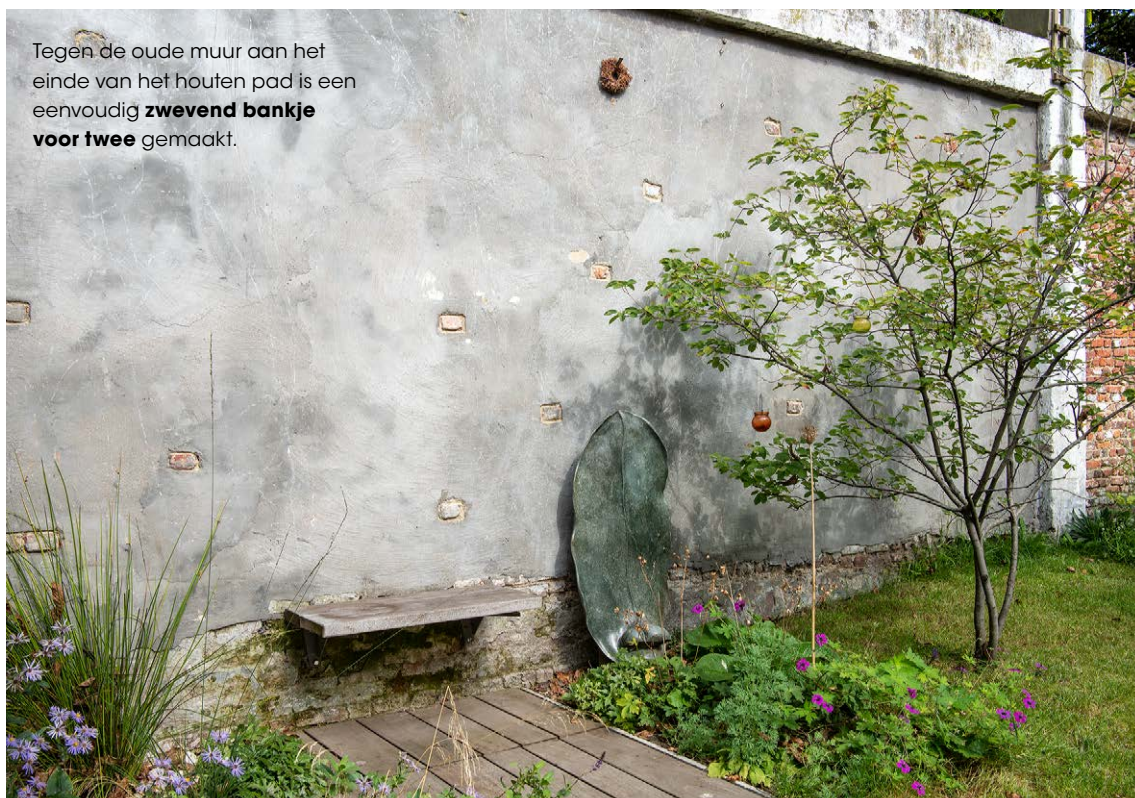
Tegen de oude muur aan het einde van het houten pad is een eenvoudig zwevend bankje voor twee gemaakt.