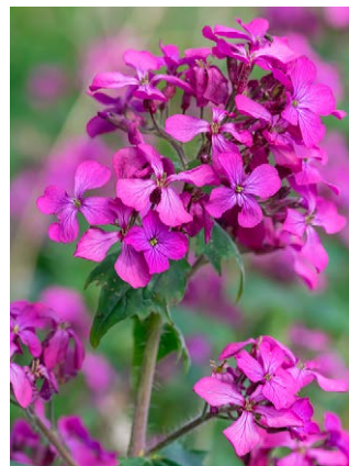
Lunaria annua (judaspenning)