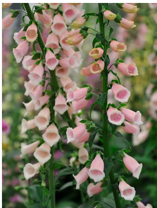
Digitalis purpurea 'Sutton' Apricot' (vingerhoedskruid)