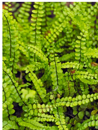
Asplenium trichomanes (steenbreekvaren)