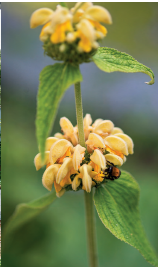
Phlomis russeliana bloeit van mei tot september.