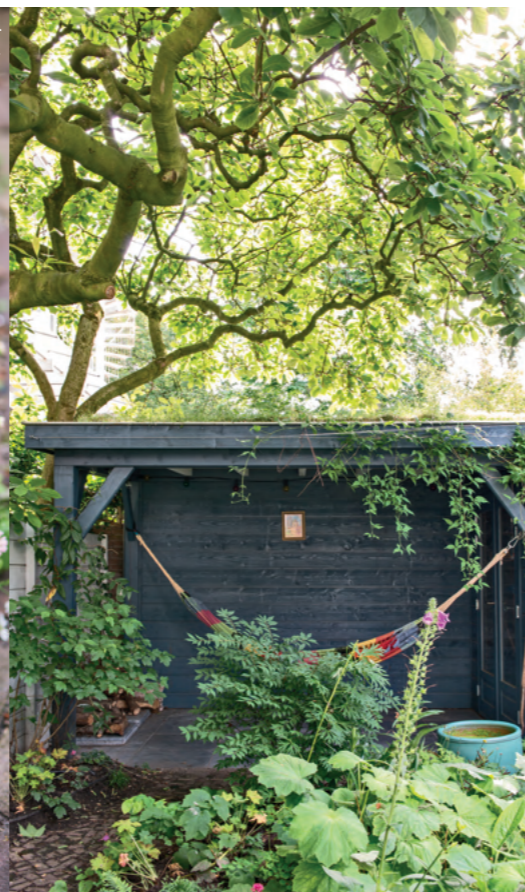
Op de voorgrond: het grote viltige blad is van de Boehmeria platanifolia .