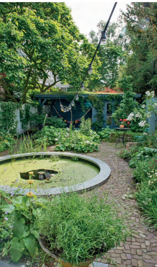
Op de voorgrond: het lichtgele bloempje is Phlomis russeliana . In de pot bloeit lavendel.