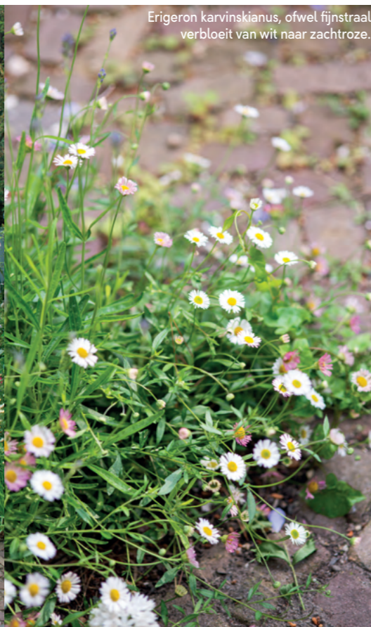
Erigeron karvinskianus , ofwel fijnstraal verbloeit van wit naar zachtroze.