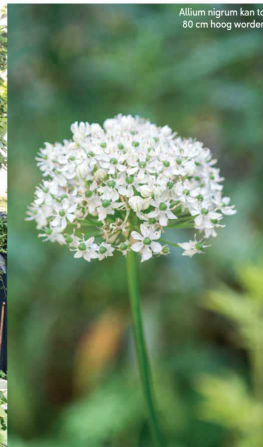
Allium nigrum kan tot 80 cm hoog worden.