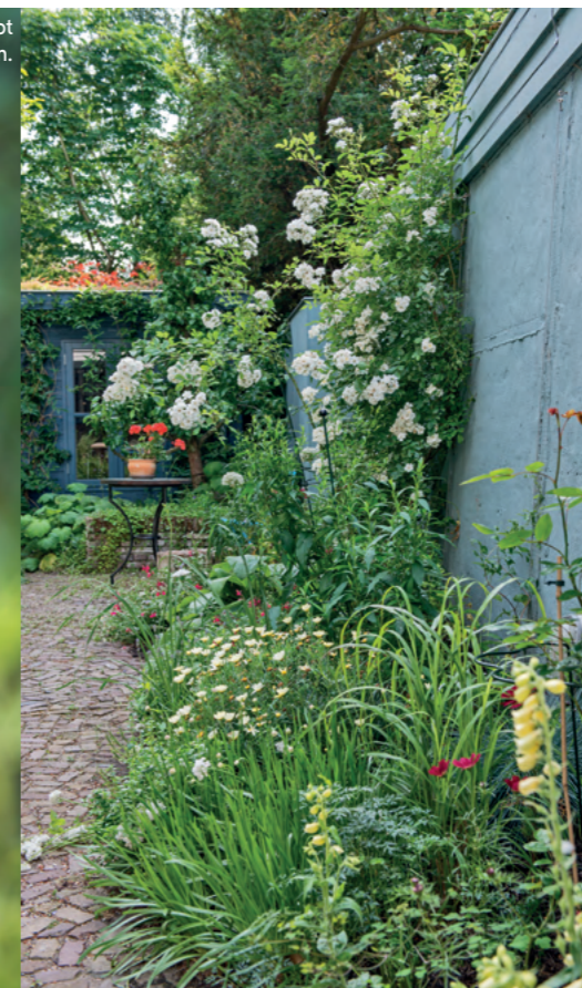
Vooran: gele Digitalis . Tegen de muur bloeit de witte Rosa 'Guirlande d'Amour' uitbundig.