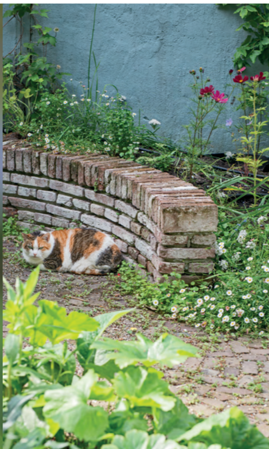
Het blad op de voorgrond is van Alchemilla mollis, bij het muurtje bloeit Erigeron karvinskianus.