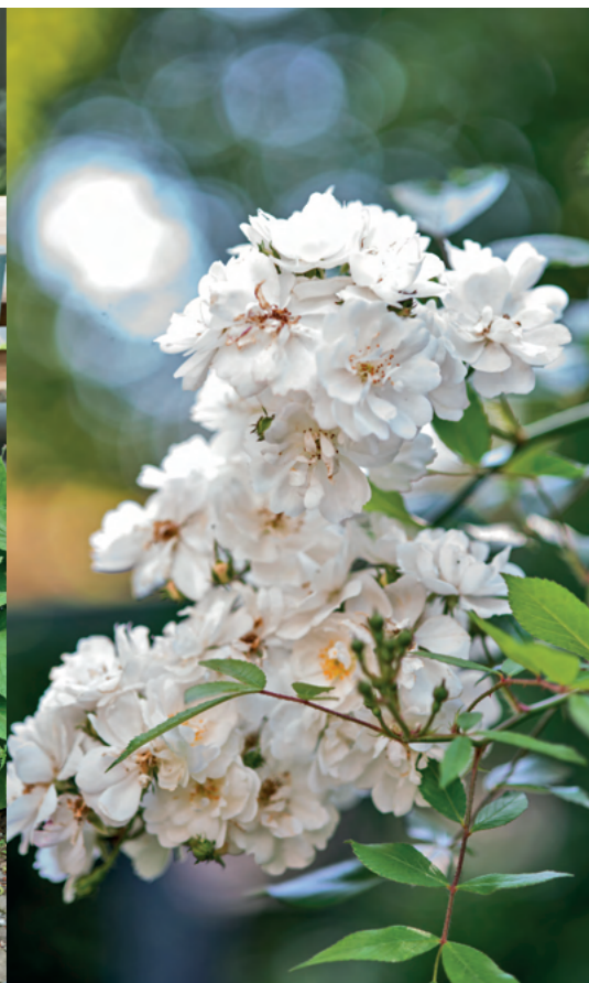
Rosa 'Guirlande d'Amour'.