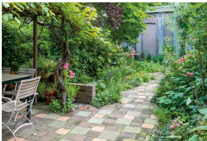
Zicht op de tuin vanaf het huis. Het dwarse muurtje geeft dieptewerking in deze groene tuin.

romantische, oranjegele roos SEDANA. "Die kleur heb ik met opzet gekozen. Hij past bij de romantische sfeer van het koetshuis, maar ook bij de oranjegele plavuizen. In de tuin zijn nog een aantal planten uitgekozen op hun roodachtige bloeikleur, zoals rode venkel en rode vlier: zo komen bestrating en beplanting bij elkaar." ►