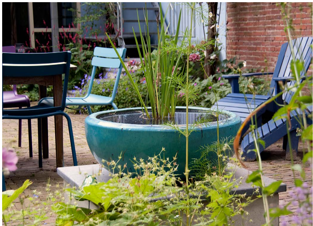
De waterbak was er al; op het verhoogde plateau komt hij nu goed tot zijn recht.