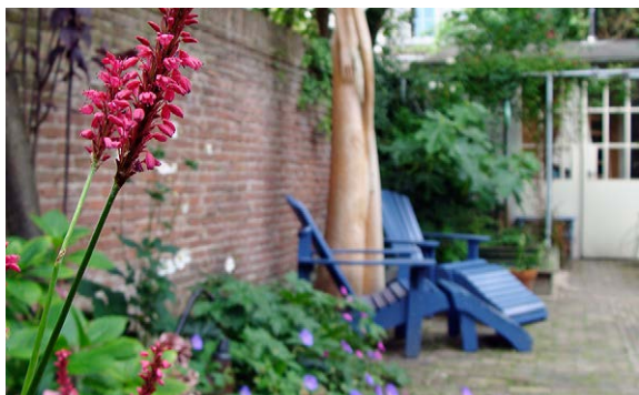
Boven: De weelderige Persicaria amplexicaulis 'Speciosa' (duizendknoop) past goed bij de vrijblijvende sfeer in de tuin.

„De tuin was erg overwoekerd en werd nauwelijks gebruikt. De bewoners wonen boven; er was een steile trap naar de tuin maar ze zaten altijd op het balkon. De trap heb ik vervangen in de stijl van het balkon, met gegalvaniseerd ijzer. Ik heb de trap een draai gegeven waardoor je nu dwars de tuin in gaat, hierdoor kun je meer hoekjes maken en lijkt de tuin minder lang en smal. Links is een terras in de avondzon en aan de zijkant rechts is een verhoogde bak met een zitrand ter hoogte van de eettafel. Voor de waterbak, die de bewoners al hadden, is een plateau gemaakt en bij de zandbak is een verhoogde rand waar ze dingen op kunnen zetten. Het is een speels huis van binnen - er zitten ook niveaunderschillen in - en dat wilde ik buiten ook doen. Het is een echte gebruikstuin geworden, dat kun je wel zien!”