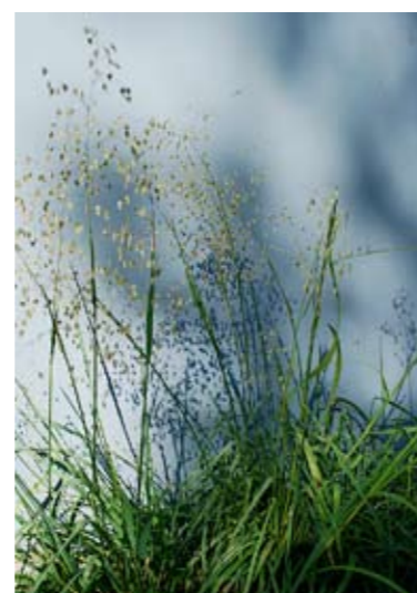
Trilgras ( Briza media )