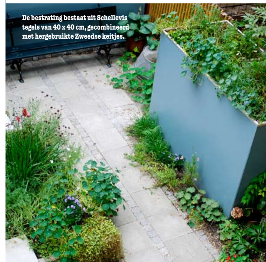
De bestrating bestaat uit Schellevistegels van 40 x 40 cm, gecombineerd met hergebruikte Zweedse keitjes.