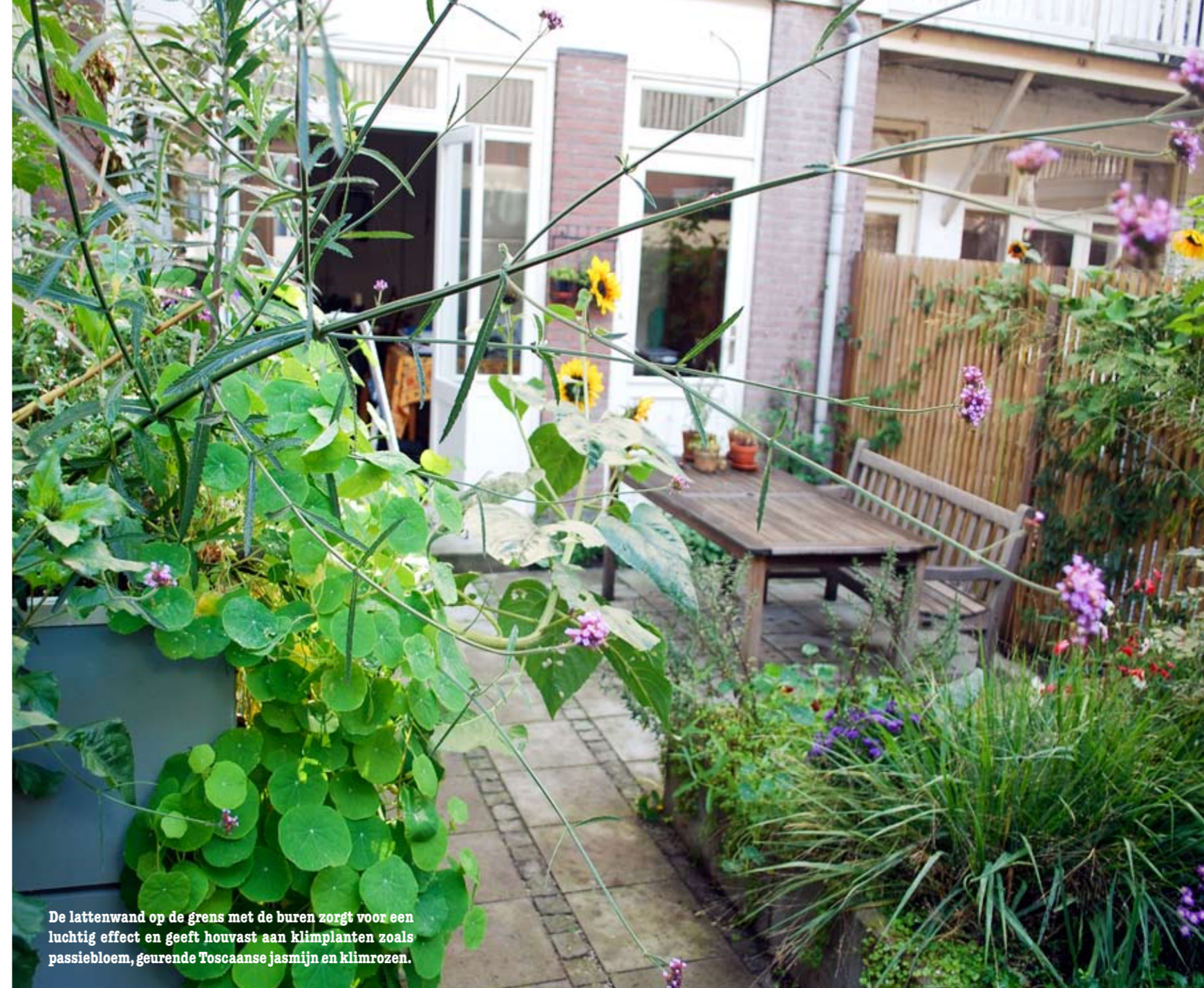
De lattenwand op de grens met de burens zorgt voor een luchtig effect en geeft houvast aan klimplanten zoals passiebloem, geurende Toscaanse jasmijn en klimrozen.